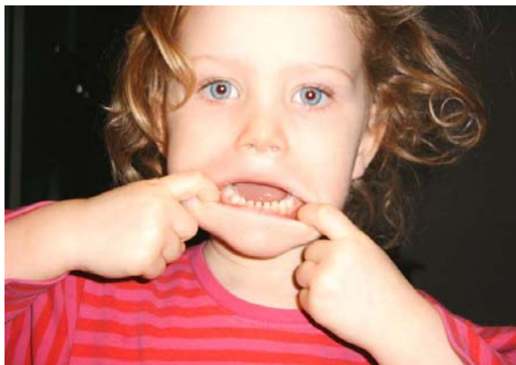
En sød lille giraf kan også vise tænder