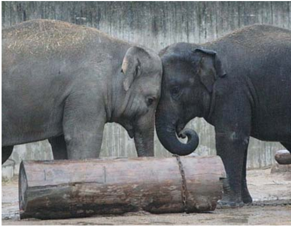
Der er andre måder at løse konflikter på end at lege "to tykhuder støder hovederne sammen"...

Hun var ikke tryk ved at få dråberne i øjnene, og forklaringer og tryglen havde ikke den ønskede effekt. Vi forsøgte endda, i samråd med hende, at vente til hun var faldet i søvn. Men så vågnede hun og fik et raserianfald af dimensioner.