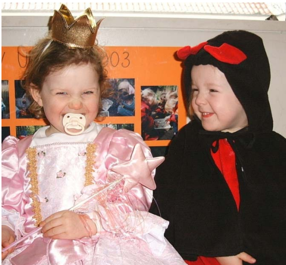
Prinsesse og djævel – måske er der plads til begge dele