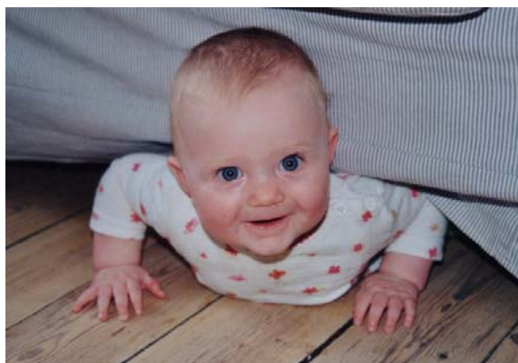
Kravlebarnet på vej ud i verden

Problemet opstår, når børnene bliver større og mere selvstændige, og vi forældre ikke altid kan se, hvordan vi skal få vore egne behov opfyldt uden at bruge den gode gamle "skyld-skam-og-pligt"-model. Oftest i afmagt eller fordi vi er bange for, hvad der ellers vil ske med vores