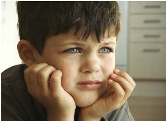
Det kan være svært at udtrykke, hvad man føler, når man er 6 år