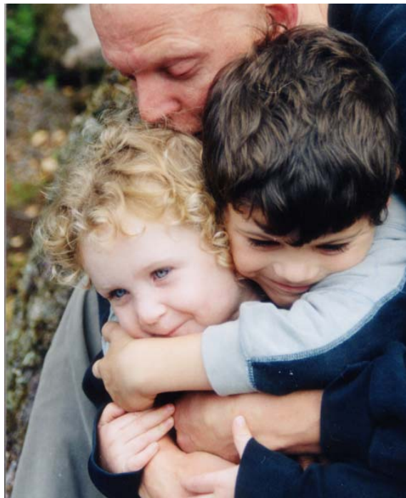
Målet med IVK er at skabe god kontakt

Det kan også være, at jeg bevidst vælger at prioritere mit behov højere end hendes, og sætter hende i cykelanhænger mod hendes vilje.