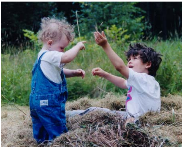
Ligeværdige børn leger bedst

Der er en indbygget faldgrube i dette: At forælderen bruger empati som en manipulationsmetode og ikke kan se andre løsninger end "op i cykelanhænger - eller kaos".